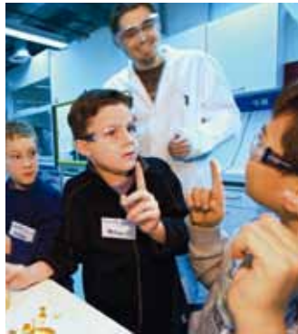
Technik in der Schule: Ich weiß was!

zum Ziel haben. Die Stärkung technischer Allgemeinbildung und die Nachwuchsfrage liegen im gemeinsamen Verantwortungsbereich von Politik, Gesellschaft, Schulen, außerschulischen Lernorten sowie der