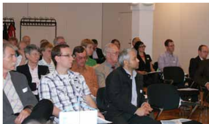
Die diesjährige AK-Leiter-Tagung stieß wieder auf großes Interesse.

Achard habe die Fachwelt angezweifelt. Erst nach einer ausführlichen Schrift habe der König deren Wichtigkeit erkannt, Geld gewährt, so dass 1802 die technische Zuckerproduktion habe beginnen können. Im 19. Jahrhundert war nach den Aussagen der Autorin Erfindergeist gefragt. Und in Berlin sei es zu bedeutenden Erfindungen, wie Augenspiegel, Büstenhalter, elektrischer Beleuchtung, Lokomotive, Ringofen, Thermokanne gekommen. Für die Hygiene wichtig gewesen seien Toilettenspüler und Klosettpapier und für die Umwelt Müllabfuhr und Müllverbrennung. Viele Berliner Erfindungen seien um die Welt gegangen, manche hätten nur regionale Bedeutung erhalten oder seien wieder in Vergessenheit geraten.