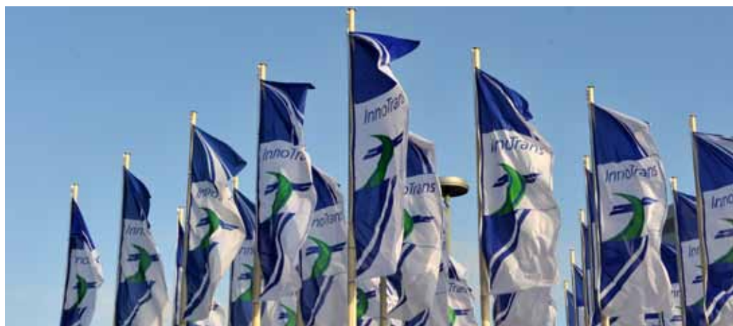
Vom 18. bis 21. September 2012 werden wieder die Fahnen der InnoTrans vor dem Berliner Messegelände wehen.

onale Leitmesse für Verkehrstechnik in Berlin. Über 2.500 Aussteller aus 48 Ländern werden ihre innovativen Produkte und Dienstleistungen auf der InnoTrans 2012 präsentieren. Erwartet werden etwa 100.000 Fachbesucher aus über 100 Ländern. Zu den fünf Messesegmenten der neunten InnoTrans zählen Railway Technology, Railway Infrastructure, Tunnel Construction, Interiors und Public Transport. Veranstalter ist die Messe Berlin. Mehr Informationen unter www.innotrans.de . TB