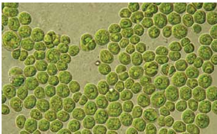
^ Scenedesmus rubescens .

Die Biomassenproduktivität beträgt 0,2 kg Trockensubstanz pro Kubikmeter und Stunde, somit einen Faktor 3 größer als z. B. Mais, ohne dass es zu Zielkonflikten mit der Nahrungsmittelwirtschaft käme. Zur Zeit werden die Arbeiten auf folgende Sachverhalte konzentriert: - Maßstabsvergrößerung bis hin zur industriellen Anlage, - Quantitative Produktion von Karotinoiden durch modifizierte, d. h. genetisch unveränderte Mikroalgen, - Etablierung einer Nährstoff-Kreislaufführung am Beispiel von Phosphat und Stickstoff. Zusammenfassend können Mikroalgenkulturen metabolisch angepasst und durch gezielte Beeinflussung, z.B. Zugabe von Eisensulfat, als produktive Wertstoff- und Energiequelle dienen. Eine nachhaltige Kreislaufwirtschaft ist also möglich.