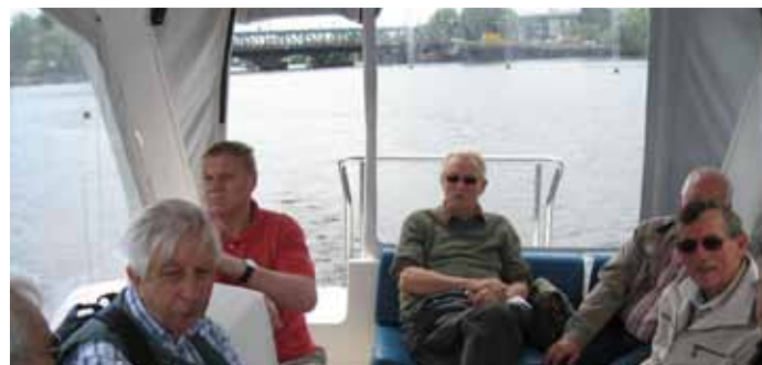
Eine Bootsfahrt, die ist lustig ...

Strom aufgeladen wurden, bis zu einer max. Leistung von 4,0 kW. Die Batterien ermöglichen einen durchgängigen Fahrbetrieb auch bei Nacht oder geringer Sonneneinstrahlung. Das Solarboot erreichte eine Höchstgeschwindigkeit von 10 km/h. Der umweltfreundliche Elektromotor sorgte für eine erholsame und ruhige Fahrt. Das Fazit: „Die Solarenergie ist auch künftig im Bootsverkehr eine zuverlässige Antriebsenergie.“ WW