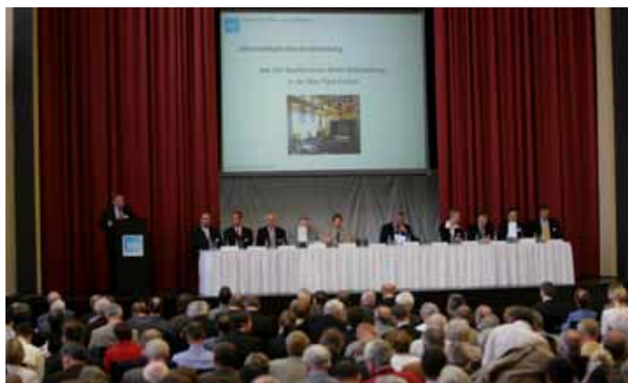
Beim Kooperationspartner Max-Taut-Schule in Berlin fand im vergangenen Jahr die Hauptversammlung des VDI Berlin-Brandenburg statt.

Die Zusammenarbeit mit der Max-Taut-Schule ermöglichte, auf den VDI bereits im Vorfeld eines Studiums aufmerksam zu machen, nicht nur in der Schule selbst, sondern auch bei gemeinsamen Auftritten bei Berufsinformationstagen der Arbeitsorganisation. Umgekehrt konnte der VDI auf die Möglichkeit technischer Bildung bereits in der Schule hinweisen und Absolventen der Schule Praktikumsplätze vermitteln. Schüler der Max-Taut-Schule haben außerdem die Möglichkeit, gemeinsam mit den Berliner SuJ-lern an der jährlichen Fahrt zur Hannover-Messe teilzunehmen.